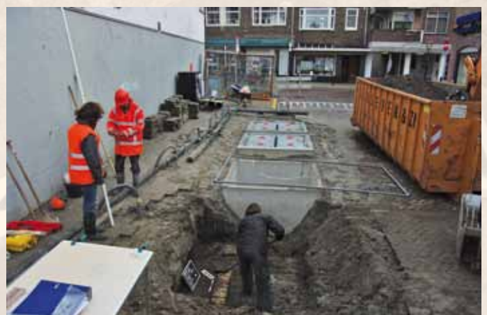
Nobelaerstraat: op de voorgrond de fundering van een woning (?). Op de achtergrond zijn de eerste al geplaatste containers zichtbaar.