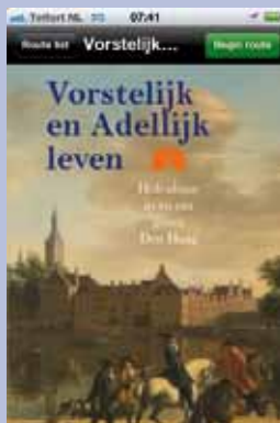
De app van de fietsroute.

De gratis geschiedenisapp 'Naar toen' wijst fietsers de weg naar het verleden. Vorstelijk en adellijk leven is deel 1 van de serie. Deze app leidt langs de buitenplaatsen van de Haagse elite in de gemeenten Rijswijk, Den Haag, Wassenaar, Voorschoten en Leidschendam-Voorburg. De route loopt via het provinciale netwerk van fietsknooppunten. De app vertelt over de edelen en vorsten die leefden in de buitenplaats waar de fietser op dat moment voor staat. Met een smartphone of tablet is de serie 'Naar toen' te