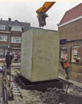
Nobelaerstraat: het plaatsen van de betonnen buitenwand.

Op 10 oktober 2012 kregen de bewoners van Oud-Rijswijk een brief van de afdeling Stadsbeheer: op 22 oktober zou de gemeente ondergrondse afvalcontainers gaan plaatsen. In de week daarvoor, vanaf 15 oktober, voerden de archeologen kleine opgravingen uit en ook daarna keken ze met de aannemer mee.