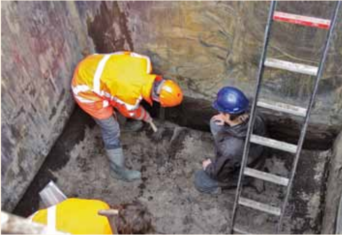
Nobelaerstraat: van het veen wordt een monster genomen.

Op 10 oktober 2012 kregen de bewoners van Oud-Rijswijk een brief van de afdeling Stadsbeheer: op 22 oktober zou de gemeente ondergrondse afvalcontainers gaan plaatsen. In de week daarvoor, vanaf 15 oktober, voerden de archeologen kleine opgravingen uit en ook daarna keken ze met de aannemer mee.