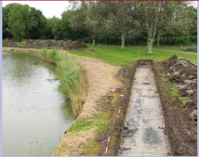
In de Zwethzone worden vijvers vergroot. Voorafgaand aan het grondwerk verrichten de archeologen onderzoek met proefsleuven.

In de omgeving van de Zwethzone zijn eerder belangrijke archeologische vondsten gedaan, bijvoorbeeld bij Rijswijk-De Bult (een opgraving aan de Tubasingel in 1967-1969) en in de Hoekpolder. Daarom waren – nu zich de gelegenheid voordeed om opgravingen in de Zwethzone te doen – de verwachtingen hooggespannen. We zouden er resten kunnen aantreffen uit de Late Steentijd, de Romeinse tijd, de Late Middeleeuwen en de Nieuwe tijd. Daarom hebben archeologen van de gemeente Rijswijk er van 28 juni tot en met 6 oktober onderzoek uitgevoerd. In totaal werden er in het Wilheminapark, in Sion en langs de Mgr. Bekkerslaan 9 opgravingsputten en 39 proefsleuven aangelegd.