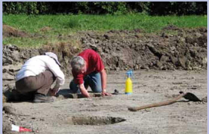
Links: handwerk in de proefsleuf. Boven: archeologen aan het werk.