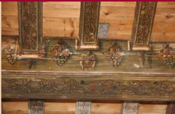
Achter een modern plafond kwam een beschilderd zeventiende-eeuws balkenplafond te voorschijn. Een detailopname toont de fraaie decoratie.

Verder hebben vijf eigenaren van een monument een gemailleerd monumentenbord ontvangen. Zo'n bord bevat informatie over het monument en komt aan de gevel te hangen, ter informatie van de voorbijgangers.