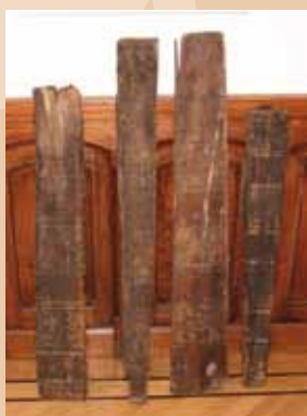
De vier gevonden vloerplanken

Het balkenplafond was helaas niet compleet, omdat de vloerplanken waren verwijderd. Maar in oktober 2010, nadat een twintigste-eeuws trapje aan de achterkant van