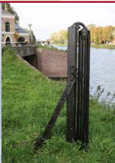
De rolpaal aan het Jaagpad.

In de negentiende eeuw werd de Vliet bevaren met trekschuiten, voortgetrokken door mensen of paarden. Ze liepen over een pad langs de oever, het jaagpad; 'jagen' was de vakterm voor het voort-slepen van een trekschuit. Waar de Vliet een bocht maakte, dreigde de schuit de kant in getrokken te worden en om dat te voorkomen werd het sleeptouw langs een rolpaal geleid.