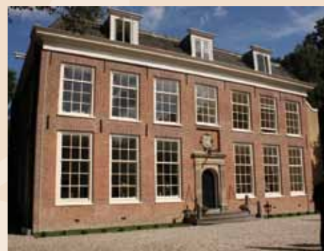
De voorgevel van Overvoorde.

Overvoorde was afgebroken, vond de eigenaar daaronder vier beschilderde planken. Ze hadden gedeeltelijk in de modder en het beton gelegen en waren redelijk goed bewaard. Misschien kunnen ze helpen het hele plafond te reconstrueren, maar dan zal onderzoek moeten uitwijzen dat het inderdaad vloerdelen van dit plafond waren. Een andere mogelijkheid is dat ze uit een andere kamer afkomstig zijn.