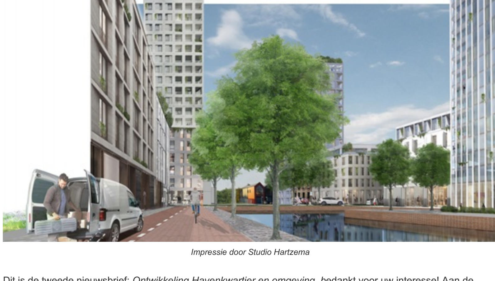
Impressie door Studio Hartzema

Ontwikkeling Havenkwartier en omgeving Juli 2021 | nummer 02