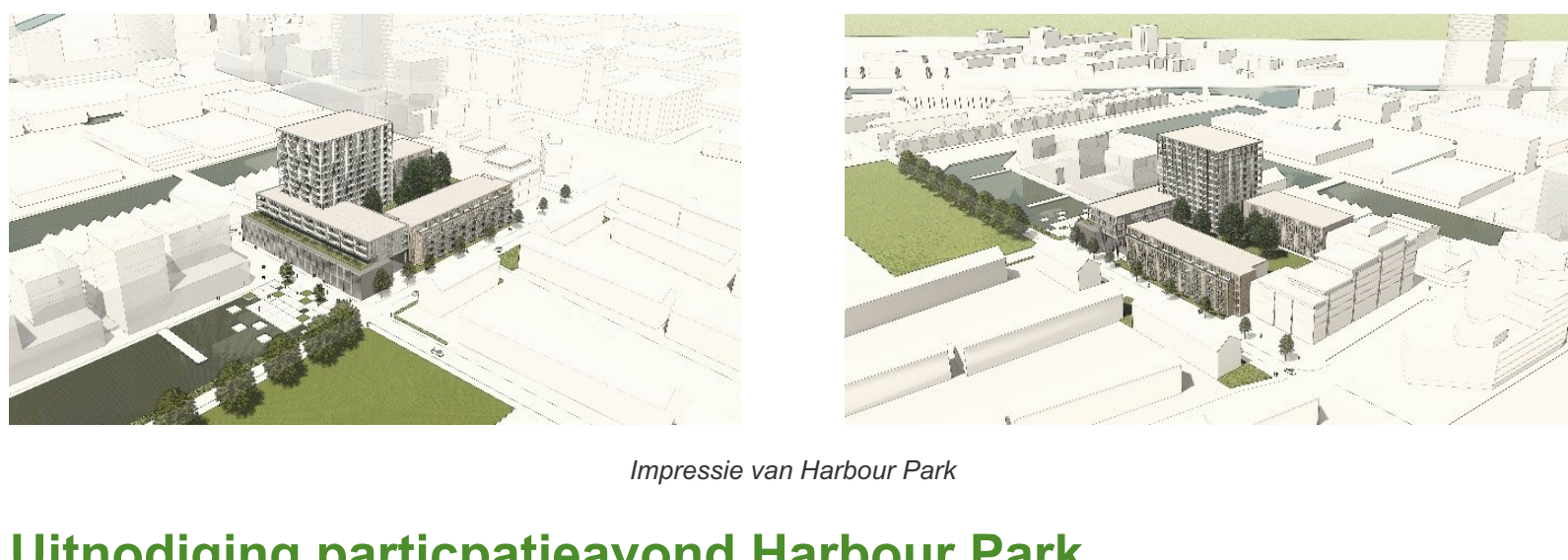
Impressie van Harbour Park