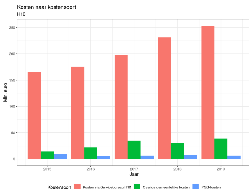
Figuur 1: Ontwikkeling van de kosten die via het Servicebureau H10 zijn ingekocht, de overige gemeentelijke kosten en de PGB-kosten

Voor de centraal ingekochte jeugdzorg, dus via het Servicebureau Jeugdhulp Haaglanden, geldt dat de kosten voor de regio Haaglanden in totaal zijn gestegen van € 165 miljoen in 2015 naar € 253 miljoen in 2019. De kosten voor ingekochte jeugdzorg zijn in totaal in vijf jaar tijd met 53,16% gestegen. De kosten voor de ingekochte jeugdzorg voor de gemeente Rijswijk zijn van € 6,7 miljoen in 2015 gestegen naar € 11,4 miljoen in 2019. Dit is een stijging van 70,57%. De kosten voor ingekochte jeugdzorg voor de gemeente Rijswijk zijn dus harder gestegen dan voor de regio Haaglanden in totaal (zie tabel 1).