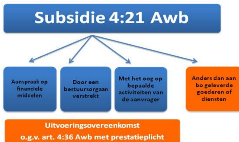
Figuur 2 – Overeenkomst met prestatieverplichting

Transacties die in ons nationale recht onder de subsidietitel van de Awb zijn gebracht, kunnen onder het begrip "overheidsopdracht" vallen. Er kan daarom niet van worden uitgegaan dat bij subsidieverstrekking geen aanbestedingsplicht bestaat.